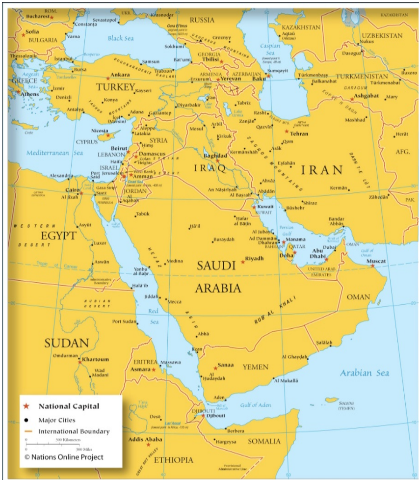
نقشه ۱- موقعیت استراتژیکی سوریه در آسیای غربی و خاورمیانه