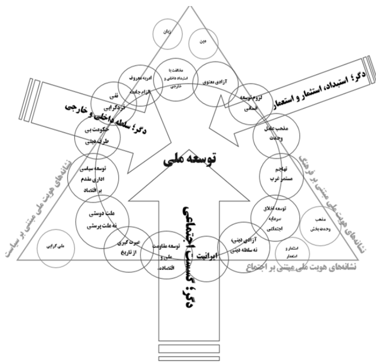
(الگوی ۴) الگوی گفتمان هویتی توسعه‌نگر ملی سحابی

افتاده اما همه این امور بر محور توسعه ملی بعنوان دال برتر استوار بوده است. وی در پی مسئولیت اجتماعی افراد جامعه (سحابی، مجله کیان شماره ۲۳) است.