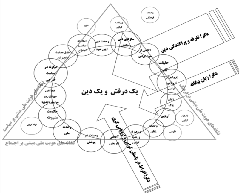
(الگو-۳) گفتمان وحدت سرزمینی کسروی

تبیین کسروی از این که چرا ایران عقب ماند این است که: «علت رشدنیافتگی ایران چندپارگی آن بود. امپریالیست‌ها فرقه‌های مختلف را پدید نیاوردند: آن‌ها تنها از وجودش سوء استفاده کردند»؛ «در نظر کسروی، تنها ایدئولوژی‌های راستین - نه قدرت‌های تحمیلی، نه قانون و نه نهادهای دولتی - می‌توانند گروه‌ها و افراد متنازع را در قالب ملتی به هم پیوسته گرد هم آورند» (آبراهامیان، ۱۳۹۰). کسروی در نهایت چنان آنتونی اسمیت (۲۰۰۳: ۴۵) معتقد است که ملی‌گرایی در معنای واقعی خود می‌تواند یک مذهب باشد و یک ارتباط عاطفی بین مذهب و احساسات ملی‌گرایانه وجود دارد؛ کسروی نیز آرزو داشت کارزاری ملی برای حذف دستجات موجود در کشور به پا کند، ولی او تنها دسته جدیدی ایجاد کرد. از ترکیب دال‌های اصلی حوزه گفتمانی کسروی با یکدیگر زنجیره هم‌ارزی شکل می‌گیرد. این دال‌ها به خودی خود معنایی ندارند و از طریق زنجیره هم‌ارزی با لحاظ نمودن واژه «وحدت» که به آنها معنا می‌بخشد ترکیب می‌شود. هویت ملی کسروی ذات‌گرا است؛ هرچند در ادامه شاهد خواهیم بود که از جاشدگی انقلاب اسلامی ۱۳۵۷ سبب شد این گفتمان با جریان