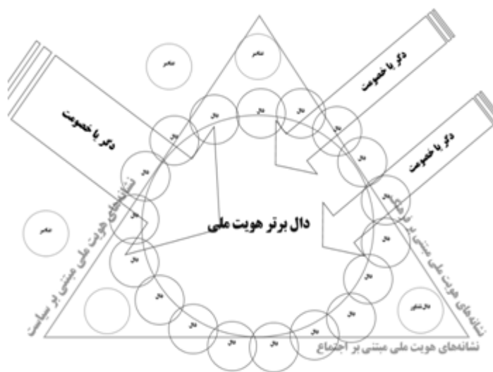
(الگو - ۲)

غیریت (Antagonism) و عناصر (Elements) بهره می‌گیرد. در الگوی جریان-گفتمان و با توجه به ظرفیت‌های نظریه گفتمان لاکلاوموف و ظرفیت‌های روشی جریان‌شناسی سیاسی، پژوهشگران بسان معجونی مشترک می‌توانند با بهره‌گیری از نقاط قوت هریک از آنها به مولفه‌های زبان، بستر واقعیت‌های اجتماعی و جریانی بطور همزمان پردازد. در همین راستا الگوی ۲ به عنوان الگوی تبیین گفتمانی هویت، برخوردار از روش تحلیل گفتمان لاکلاوموف جهت خوانش هویت ملی یکی از جریانهای فکری سیاسی معاصر ایران می‌باشد که در آن ضمن توجه به سه وجه سیاست، اجتماع و فرهنگ، دالها و دگرها و عناصر بصورت ذیل تبیین خواهد شد.