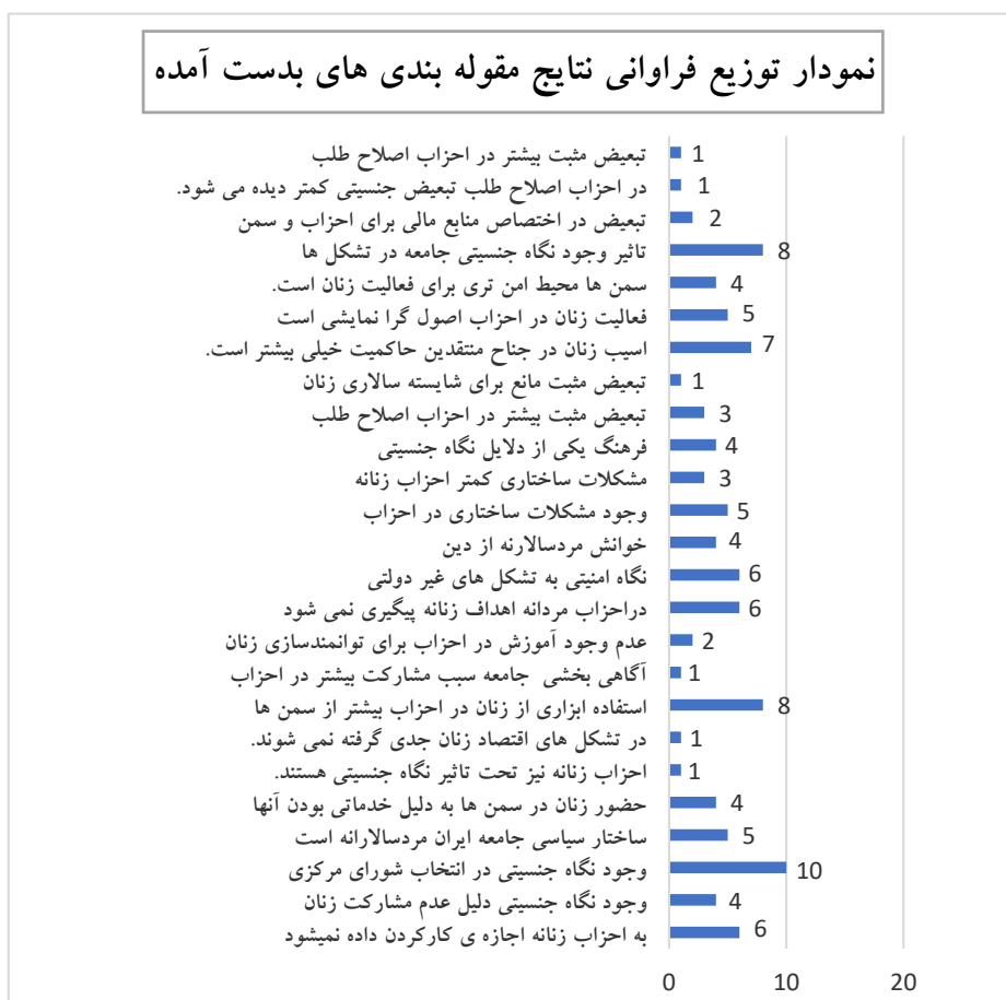
نمودار ۱. نمودار توزیع فراوانی پاسخ های مصاحبه شونده گان (مقوله وجود تبعیض جنسیتی در احزاب و سمن ها)

احزاب به خصوص برای پذیرش شرایط رهبری در حزب و یا عضویت در شورای مرکزی عاملی تقویت کننده است.