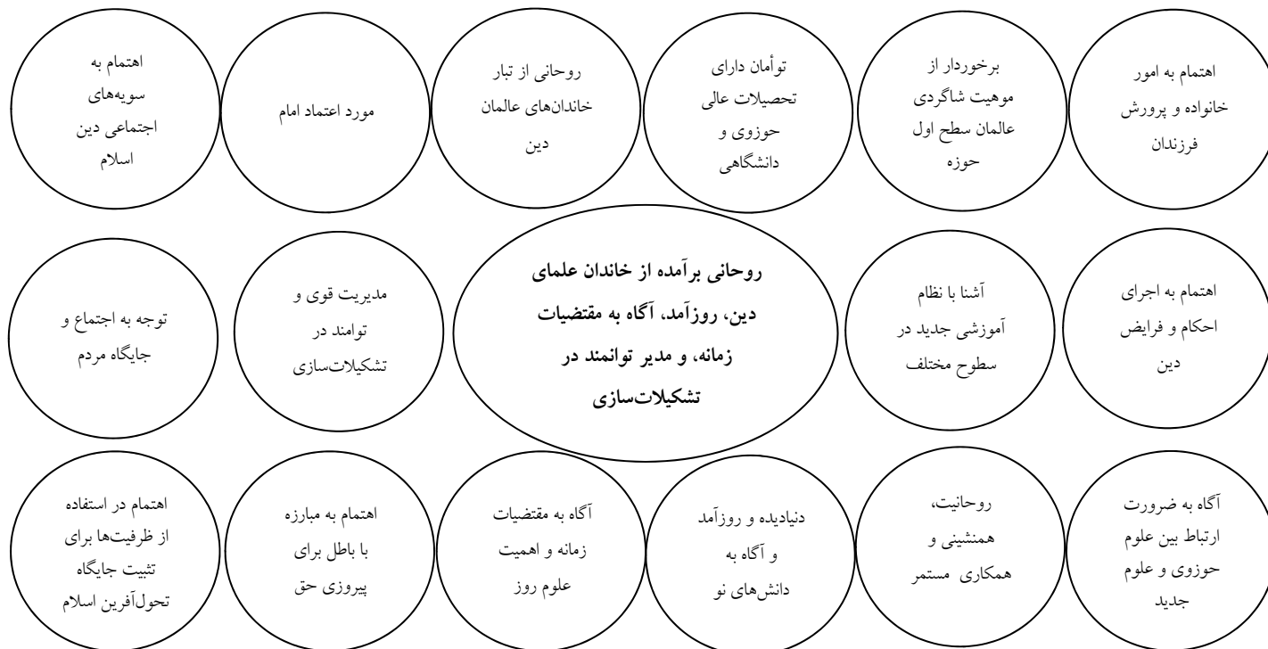
تصویر شماره ۱: مفصل‌بندی حول گره‌گاه اصلی در گفتمان شخصیت شهید بهشتی